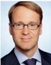
Jens Weidmann Präsident der Deutschen Bundesbank

„Cyber-Attacken können potenziell das Vertrauen der Öffentlichkeit in das Finanzsystem aushöhlen. Um die positiven Effekte einer digitalen Finanzwelt nicht zu gefährden, wird es entscheidend darauf ankommen, solche Cyber-Attacken ins Visier zu nehmen.“