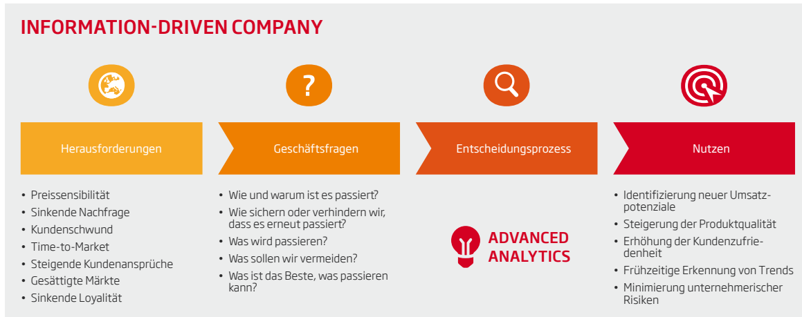
Abb. 2: Advanced Analytics unterstützt Entscheidungsprozesse im Unternehmen

Advanced Analytics kann in dieser Situation den Entscheidungsprozess optimal unterstützen und einen signifikanten unternehmerischen Nutzen generieren.