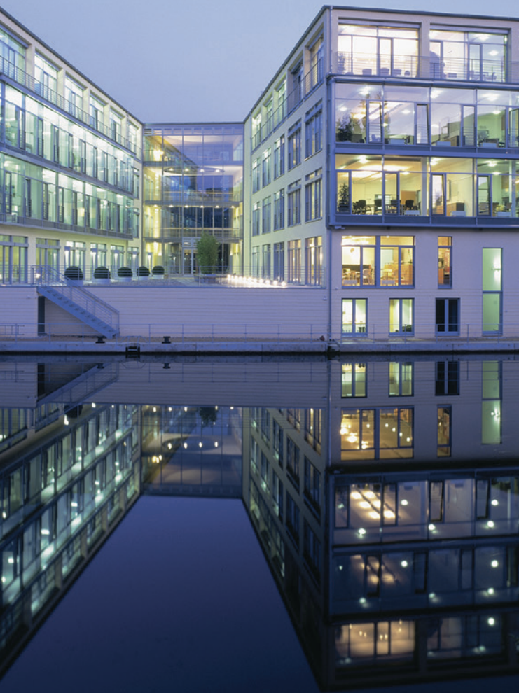
Arbeiten am Fleet - die Zentrale von Sopra Steria Consulting in Hamburg